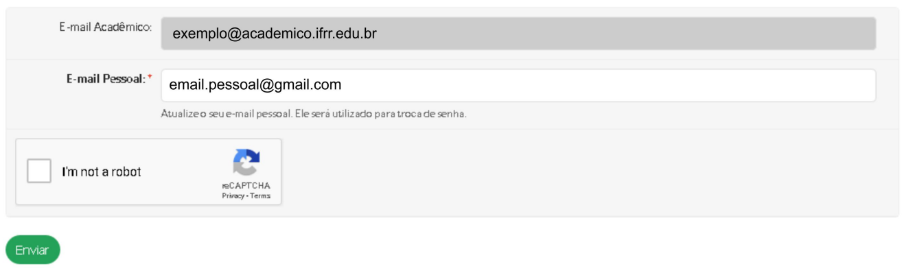
Figura 3. Tela de Troca de Senha do E-mail Acadêmico

Ainda na tela de troca de senha do e-mail acadêmico o aluno deve seguir as instruções do 'Captcha' ao marcar a caixa "I'm not a robot" e finalmente clicar no botão 'Enviar'.